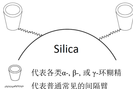
图(B).其他厂商的基于环糊精的固定相的键合示意图

目前，ChiralCD系列柱是市场上第一种通过间隔臂与环糊精宽圆环面上较弱活性的仲醇羟基反应从而固化环糊精的商业手性色谱柱。在待分离的溶质通过宽圆环面进入环糊精内腔的过程中，ChiralCD柱上的特有的手性间隔臂可提供一种额外的特殊的空间位阻效应，从而提高了手性识别能力。与其他厂商的基于环糊精手性柱相比，凯若泰ChiralCD系列柱相含有较高的环糊精键合浓度。由于ChiralCD固定相中的凯若泰公司特有的间隔臂本身含有手性功能团，并且在环糊精上的键合位置与市场上其他厂商色谱柱不同（如下图（B）所示），ChiralCD系列手性柱可以提供与市场上其他厂商的环糊精手性柱不完全相同的手性识别能力，并且在通常情况下能提供更好的色谱分离选择性。